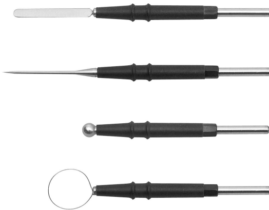
36 04 40 Spatelektrode Blade electrode