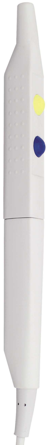
1 : 1

36 07 03 Monopolarer Handgriff mit Kabel, 4 m, für Elektroden mit Schaft Ø 2,4 mm, passend für Martin, Berchtold, Aesculap Monopolar pencil with cable, 4 m, for electrodes with shaft Ø 2,4 mm, fits Martin, Berchtold, Aesculap